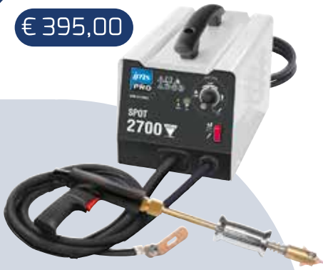
VRIMAC SPOT 2700 230V