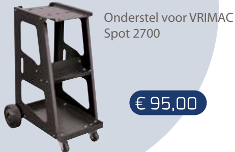
Onderstel voor VRIMAC Spot 2700