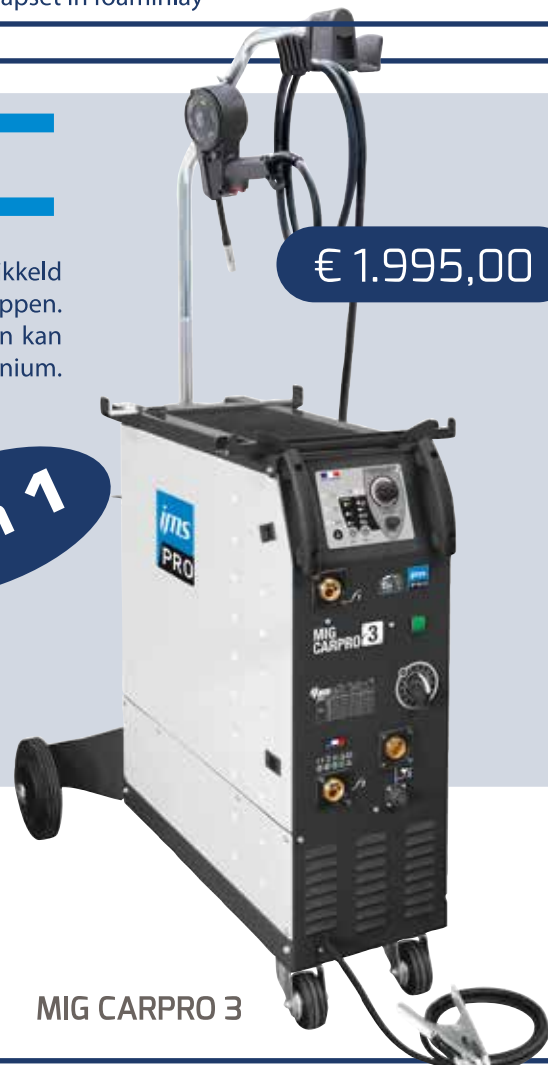
MIG CARPRO 3