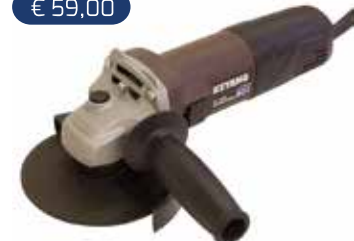
KEYANG DG852 125mm, 850W.