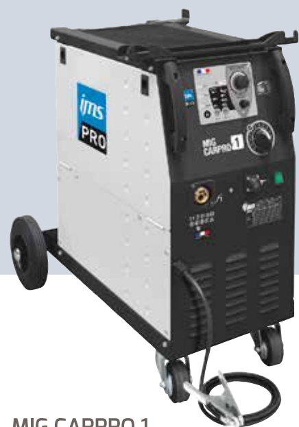
MIG CARPRO 1

De VRIMAC MIG CARPRO 1 en de MIG CARPRO 3 zijn speciaal ontwikkeld voor autoplaatwerk en beschikken over uitstekende laseigenschappen. De MIG CARPRO 3 wordt geleverd met 2 toortsen en een Spool on Gun en kan hierdoor worden gebruikt met 3 lasdraden bijv. staal, CuSi3 en aluminium.