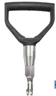
ALU PULLER incl. adapters